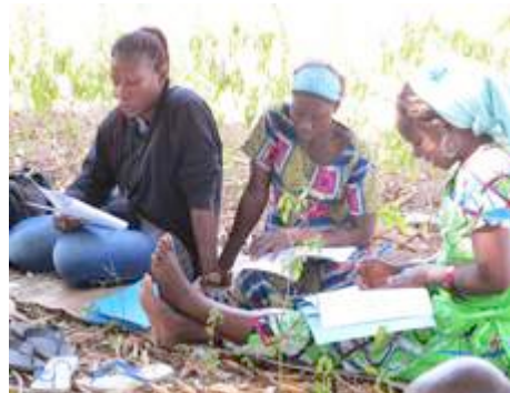
Relecture de la brochure au Bénin lors de l'échange

A la demande de plusieurs organisations paysannes, ONG d'appui ou bailleurs, une brochure est en cours de réalisation. L'objectif est de réaliser une brochure illustrée avec un livret comprenant les principes généraux : enjeux, principes de culture en agroécologie, de sélection, de conservation... et une série de fiches par type de culture. 80 % de la brochure ont été rédigés et elle a pu être partagée et testée avec plusieurs praticiens notamment lors d'un échange-formation sur la production de semences