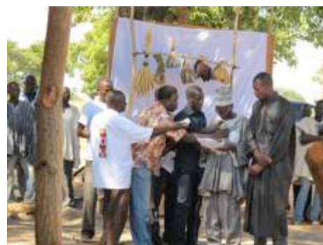
Ouverture de la bourse de Tabi

► Fin 2013, un échange paysan a été organisé au Togo-Bénin avec les différents représentants des terroirs sources et des organisations. Une vingtaine de praticiens des semences paysannes venus du Sénégal, du Mali, du Burkina, du Togo, du Bénin et de France ont échangé et témoigné auprès de leurs pairs togolais et béninois, de leurs expériences et de leur combat pour le maintien et la valorisation de la biodiversité cultivée en agroécologie paysanne.