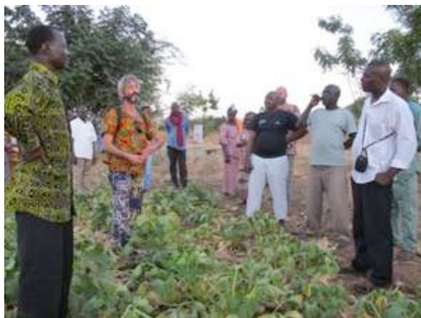
Echange au champ sur la sélection de la courgette

▷ Les perspectives pour l'accompagnement d'un réseau sur l'expérimentation de la production de semences potagères en agriculture biologique sont prometteuses. Une forte volonté de voir émerger un réseau sous régional de producteurs de semences potagères biologiques s'est exprimée. Les prémices de ce réseau ont été mises en place et les premières expérimentations auront lieu en 2014. ▷ Cependant un important travail de suivi et de partage d'information est nécessaire. Les praticiens ont souhaité que, dans un premier temps, la responsabilité de ce travail revienne à BEDE avec sa coordination basée au Mali.