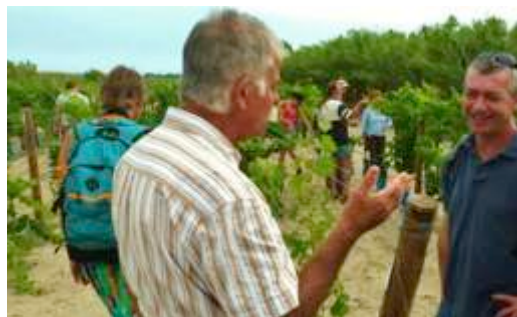
Visite au conservatoire de Vassal

► Une rencontre a été organisée en août autour de la collection de cépages du Domaine de Vassal (INRA, Marseillan, 34). Ce conservatoire constitue une importante source de diversité qui peut alimenter les essais des vigneronns intéressés pour explorer le potentiel de cépages locaux oubliés, ou exotiques.