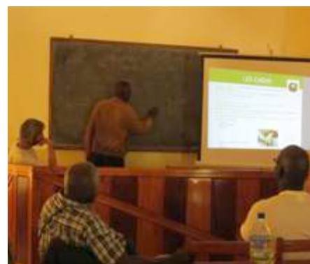
Mise au point des protocoles d'essais pour la production de semences