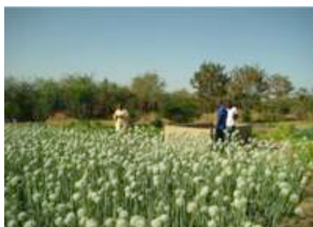
Formation à la production de semences d'oignons, jardin des femmes de Tessito, Djimini, Sénégal