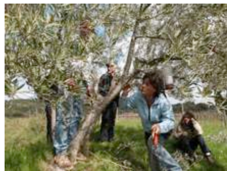
Formation à la taille des oliviers

► Des formations à l'arboriculture fruitière ont été organisées avec l'association Le Filon pour que les membres de Chemin Cueillant maîtrisent les gestes de base pour un bon entretien de leurs vergers (taille, badigeonnage des troncs et charpentières).