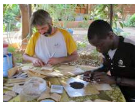
Répartition des semences en petits lots pour diffusion sur différents sites

► Renforcement du COASP : Ensemble, ils ont discuté de l'avenir du COASP, un comité informel de consultation et de coordination des producteurs de semences paysannes d'Afrique de l'Ouest mis en place à la Foire de semences paysannes de Djimini au Sénégal en 2011. Le COASP contribuera à l'organisation de la prochaine foire à l'invitation de l'ASPSP.