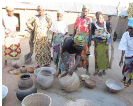
Démonstration de conservation semences de Niébé au Togo

Il existe partout en Afrique de l'Ouest un patrimoine semencier local riche d'une grande diversité de variétés paysannes et de savoir-faire. Elles sont des atouts pour des agricultures diversifiées, grâce à leur capacité d'adaptation, leur rusticité mais aussi parce qu'elles véhiculent d'importantes valeurs culturelles et nutritionnelles. Les paysans qui travaillent à leur reconnaissance sont porteurs d'innovations dans le domaine et ces expériences méritent d'être partagées, valorisées, et diffusées.