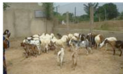
Troupeau d'ovins et caprins au CD2A

► Appui au développement du petit élevage ovin avec le CD2A et Agrobio-Savanes permettant également de renforcer les pratiques agroécologiques par la production de compost.