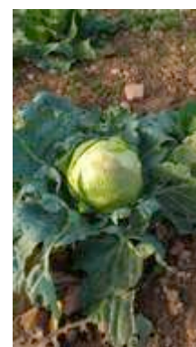
Chou de Buzau

► Rencontre sur l'autoproduction de semences potagères, ayant réuni des maraîchers et jardiniers du Minervois et quelques Semeurs du Lodévois-Larzac : discussions techniques, présentation du concept de maison de la graine, et visite de la parcelle expérimentale de choux de Mailhac réunissant 65 variétés.