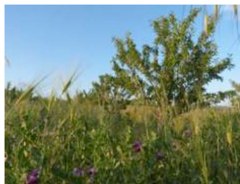
Engrais verts entre des amandiers à Mailhac