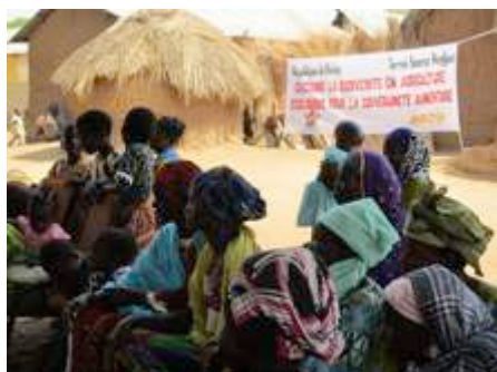
Bourse de Kpayerou

► Deux bourses d'échanges ont eu lieu, une à Tabi au Togo organisée par Agrobio-Savanes et une au hameau de Kpayerou au Bénin organisé par l'ORAD. Ces échanges ont permis de renforcer localement les organisations Agrobio-Savanes et l'ORAD en offrant une reconnaissance et une visibilité de leur travail auprès des communautés et des autorités locales. Elle a également permis de tisser des liens forts entre les membres de la délégation rejoints par de nouveaux groupes du Burkina, du Togo et du Bénin et de créer de nouveaux liens avec des organisations proches : APN, Autre Terre, CIDAP, Credi ONG.