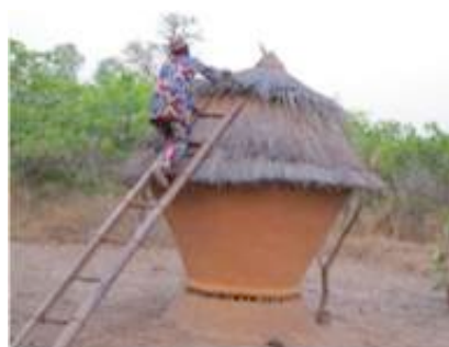
Grenier de l'ORAD